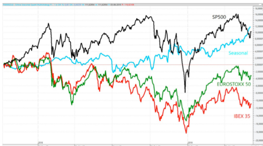
Rentabilidad acumulada en el SP500, Eurostoxx50, Ibex35 y Esfera Seasonal Quant Multistrategy, FI desde el lanzamiento del fondo.

Pero aparte de la rentabilidad obtenida, lo que más destaca es la descorrelación que tenemos con el resto de los mercados. Nuestra estrategia, como siempre hemos explicado, poco tiene que ver con los mercados tradicionales de renta variable y renta fija, basamos nuestra operativa en otros factores (estacionalidades de las materias primas, estudio de sus fundamentales, estudios de regresión a la media, etc.) y esto nos hace que podamos conseguir rendimientos positivos en cualquier entorno de mercado. Así, en momentos como el actual (o en Diciembre de 2018) de importantes correcciones en los mercados de renta variable, podemos aportar estabilidad a cualquier cartera de inversión.